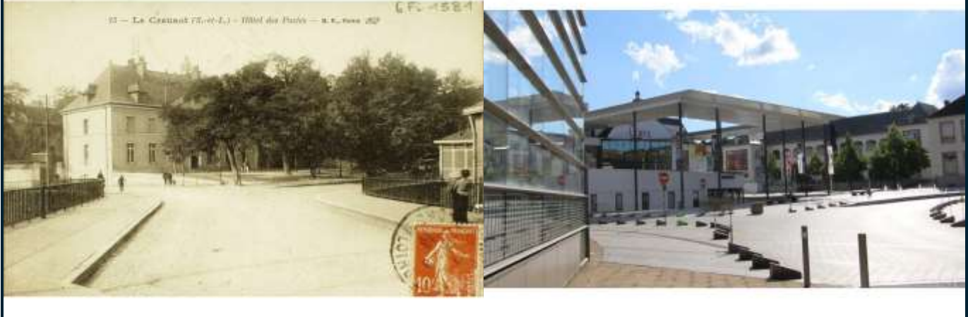
L'hôtel des Postes avant la guerre. Photo Archives départementales de Saône-et-Loire référence 6FI 1581

Cette photo, prise avant la guerre, montre l'hôtel des Postes au Creusot. Devant celui-ci, à droite, on peut voir un bâtiment, certainement une habitation.