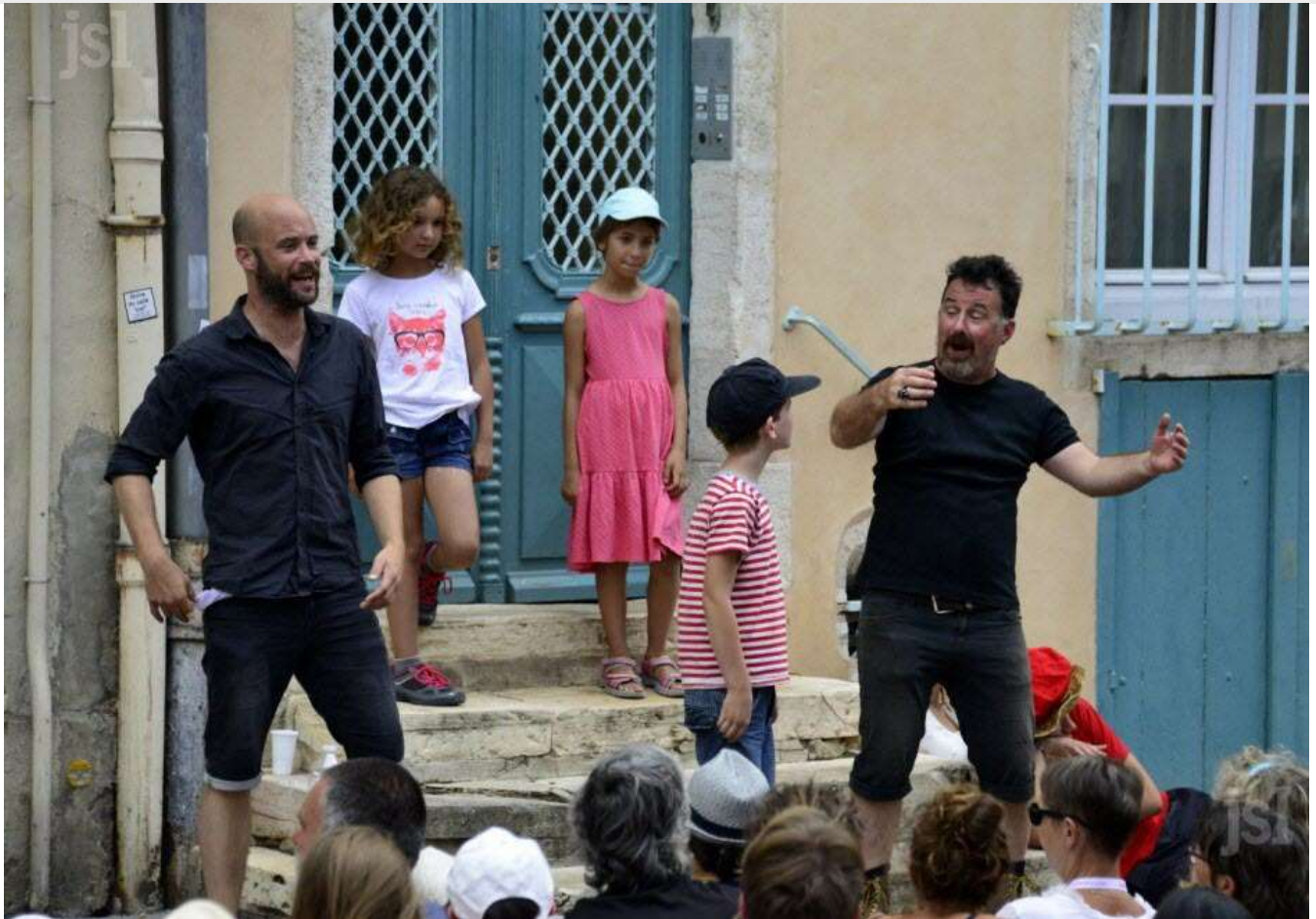
Un spectacle à voir en famille ?

Les Batteurs des pavés dynamitent les classiques et revisitent Germinal de Zola. Étienne Lantier trouve une place dans une mine du Nord. Choqué par les conditions de travail, il pousse ses camarades à la grève quand la compagnie minière décide de baisser les salaires. Un spectacle très interactif.