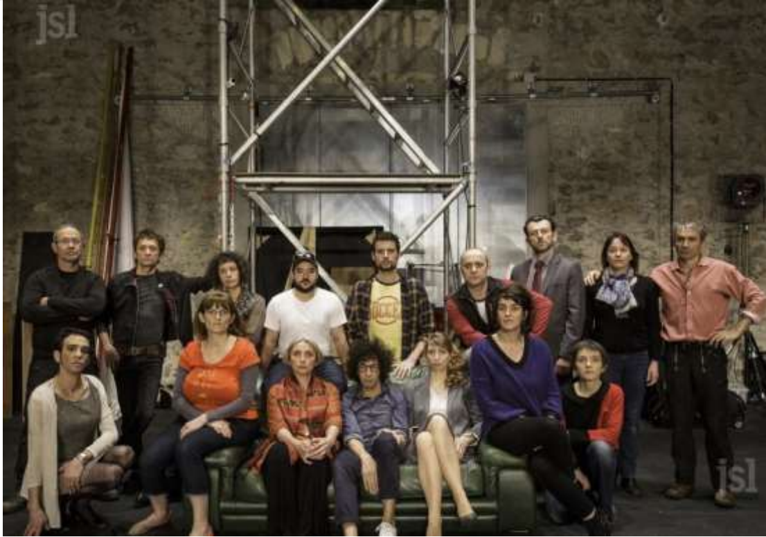
Du théâtre de rue en salle avec les 26000 couverts !

Entrez dans l'univers férocement drôle des 26 000 couverts qui dégoupillent leur « force de farce » sur le monde du théâtre et assistez à la répétition en salle d'un spectacle de rue. À moins que ce ne soit « un spectacle sur la répétition d'un spectacle sur la répétition d'un spectacle ! » Avec une insolence joyeuse, les douze comédiens vous invitent à une procession funèbre et musicale pour célébrer l'absurdité de la mort !