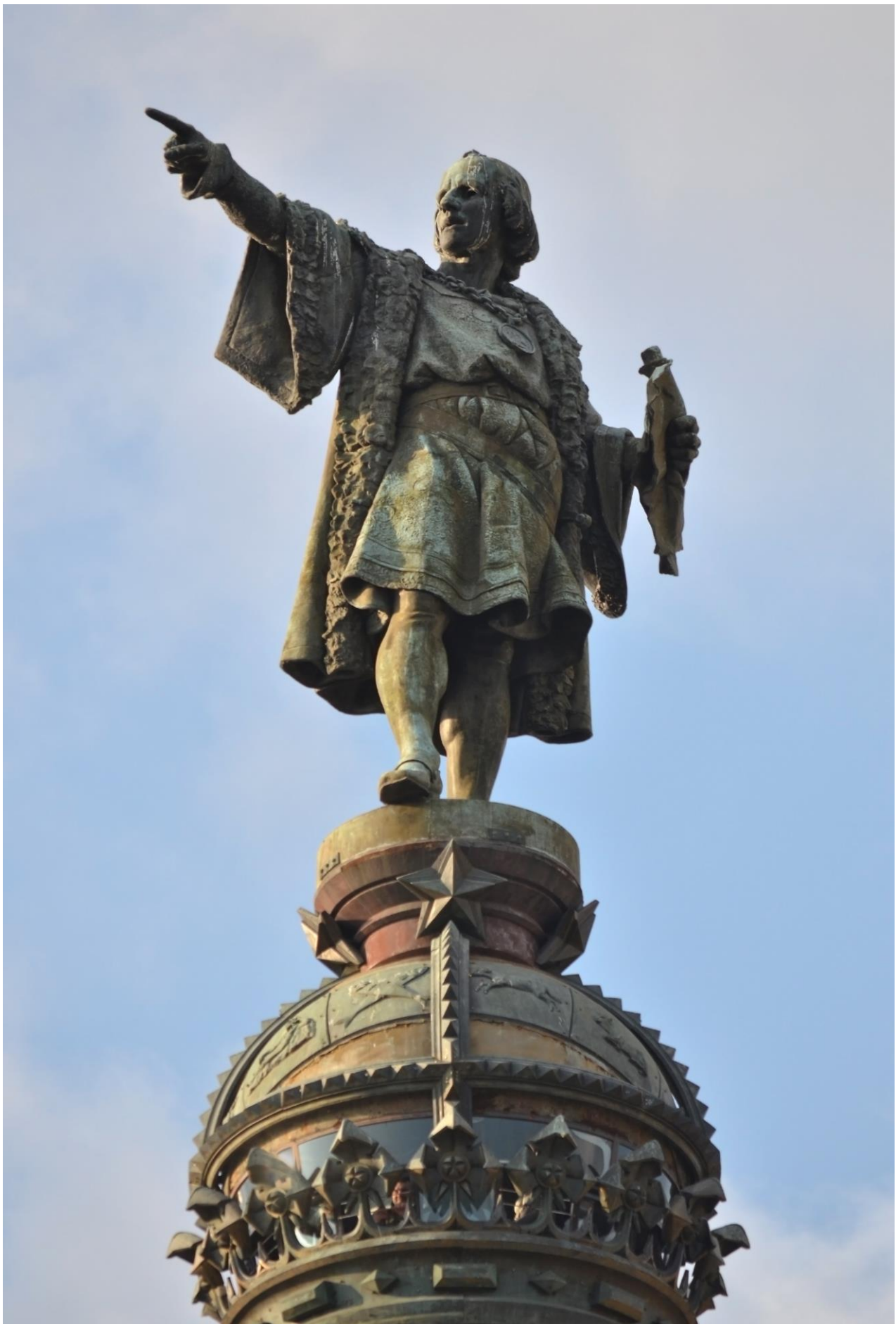
Annexe 3 : Image du film Django (1966), de Sergio Corbucci