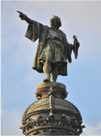
Document 3 : Image du film Django (1966), de Sergio Corbucci